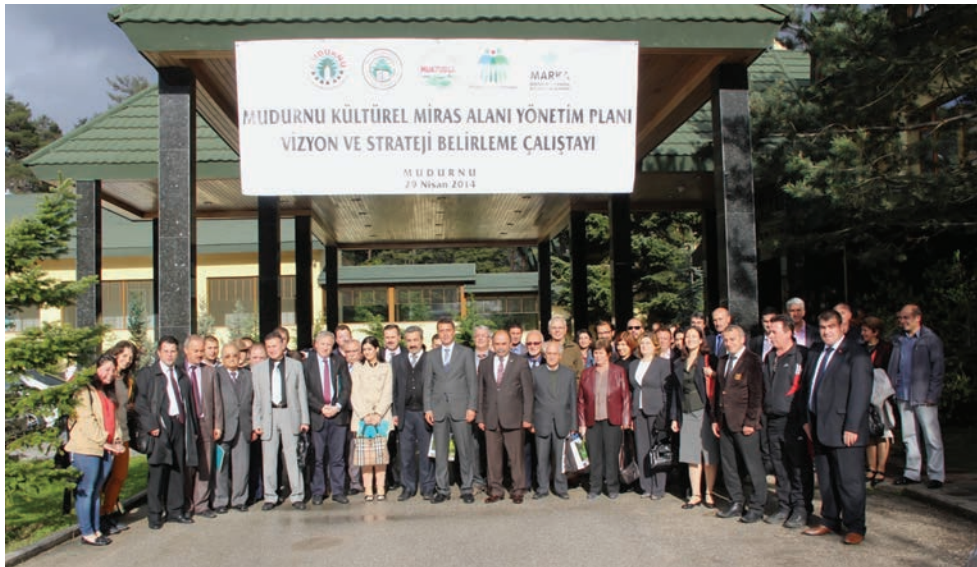
29 Nisan 2014 tarihinde Abant'ta yapılan Vizyon ve Strateji Çalıştayı